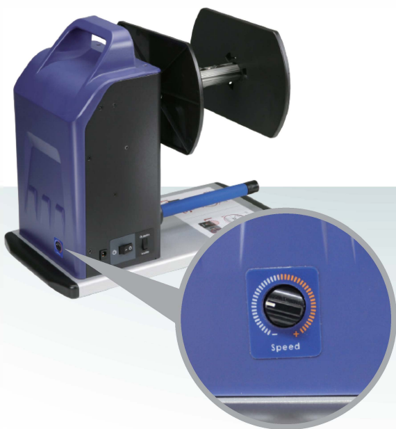
VR(ajuste de velocidad)

Equipado con una brazo de tensión móvil, funciona con cualquier impresora térmica, tanto de salida a mano derecha como izquierda. En función de las necesidades, puede rebobinar rollos de etiquetas con bobinado interno o externo.