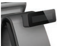
Pantalla del Cliente VFD