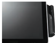
Lector (MSR, SCR)