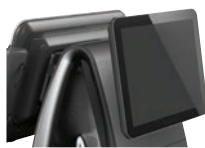
Segundo Pantalla LCD